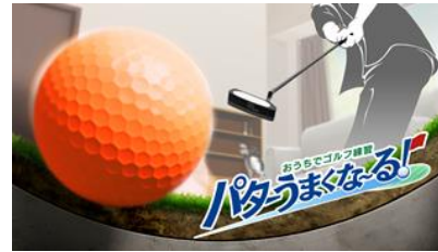
おうちでゴルフ練習 パターうまくな～る! (7月発売)