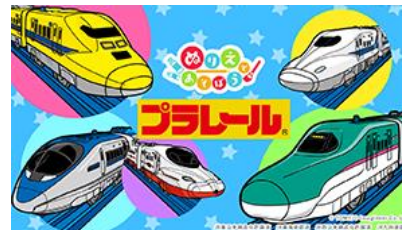
ぬりえであそぼう プラレール (7月発売)