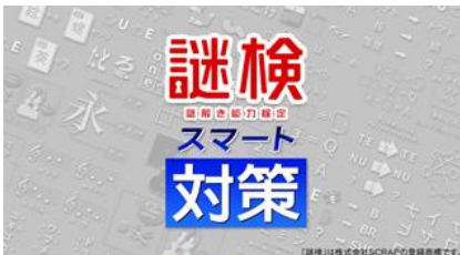
謎検 スマート対策 (7月発売)