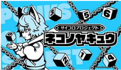
ネコノヤキュウ (6月発売)

Nintendo Switch™向けパッケージソフトを新たに4タイトル発表しました。