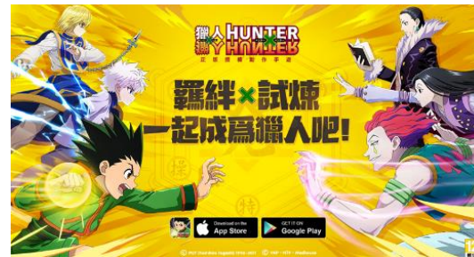
猎人 HUNTER × HUNTER