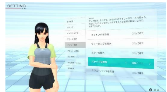
Fit Boxing 2 -リズム&エクササイズ- 2020年12月3日発売予定

※Nintendo Switchのロゴ・Nintendo Switchは任天堂株式会社の商標です。