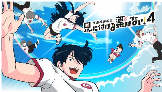
兄に付ける薬はない!4

テンセントビデオにて7億回を超える再生数を記録した大人気3Dアニメ「観海策」について、当社が日本国内向けの配信権を取得し、8月より日本で初めて本作品の配信を開始いたしました。